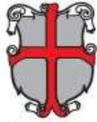
Mestna občina Ptuj